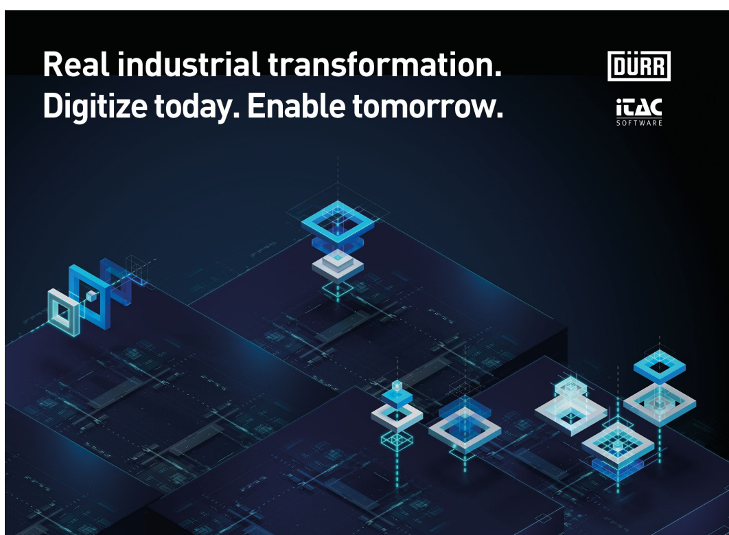
Abbildung 1: Der Dürr-Konzern zeigt bei der Hannover Messe 2023 durchgängige Lösungen für eine intelligente Fabrik

iTAC Software AG Aubachstr. 24 56410 Montabaur